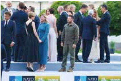
孤独な主役ゼレンスキー大統領

ゼレンスキー大統領が、ウクライナも必ず広島のように廃墟から復興すると力強く宣言したことは、ロシアと中国を名指しせずとも「加害者は誰か」と追い込むことより、自国の復興を先進国に丸投げで依頼しようという頭脳プレイだった。岸田首相はゼレンスキー大統領の宣言を受けて、よせばいいのに「世界八十億の人々がヒロシマ市民と言う時に、核兵器は無くなるだろう」と発言している。