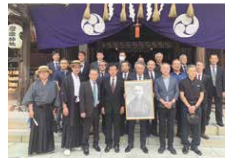
6月25日 唐津神社にて

本社 〒847-0871 佐賀県唐津市東大島町19-5 電話 090-3199-8446 no.shin.7771008@gmail.com 賛助購読料 年額 3,000円 (年10回発行) ホームページ http://大日本生産党.com/