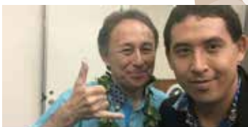
Rob Kajiwara (@robkajiwara) 返信元: @Sparky72185853さん Okinawans are not Japanese. 2019年03月26日 18:16 · Twitter Web Client

日本政府は昨年「アイヌ新法」を成立させて、北海道に於いてアイヌは先住民族であると結論付け、日本人が北海道に入植する時に先住民のアイヌが暮らしていたという「事実」を決定してしまった。重要なこ