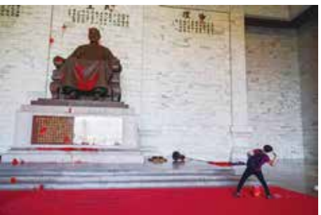
蒋介石像にペンキを投げつける若者

台湾は元々日本領土だったものが、敗戦によって領有権を放棄させられてアメリカが管理権を行使していた。中華民国の国民党が毛沢東の共産党にボロ負けして逃げ回っていた時に、蒋介石が「亡命したいので、台北に亡命政府を開かせて下さい」と泣きついて借地していただけのもの。台湾は、大陸から逃げて来た中華民国の領土ではなく、領有権が日本から独立した形で七十年以上経過したので、あとは管理権を有するアメリカが台湾の独立を保証すればよいだけのものなのだ。